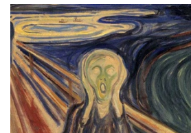
Título: El grito Autor: Edvard Munch Año: 1893 Técnica: Óleo, temple y pastel sobre cartón