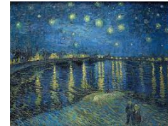
Título: Una noche estrellada Autor: Vincent van Gogh Año: 1889 Técnica: Óleo sobre lienzo