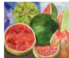
Título: Viva la vida Autora: Frida Kahlo Año: Entre 1952-1954 Técnica: Óleo sobre masonite