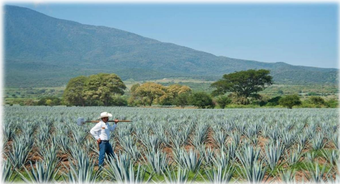
Jalisco. El estado mexicano con más sabor (reportaje 1/2)

Lee el siguiente reportaje y señala con diferentes colores las partes que contiene: