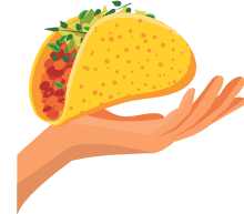
No compartir comida