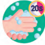
Lavado de manos