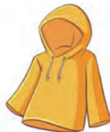
Abrigarse bien cuando hace frio