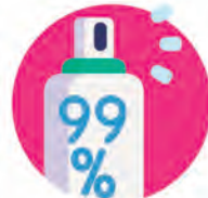
Desinfección de mesas y superficies