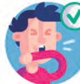
Estornudar de manera correcta