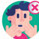
No tocarse la cara